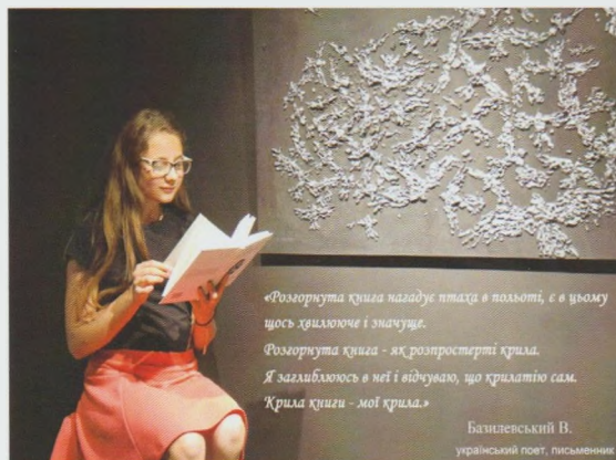
Клуб за інтересами “Поетичний розмай”. Рахівська ЦРБ

Творчий підхід бібліотечних працівників області до організації та проведення різноманітних соціокультурних заходів, акцій сприяє підвищенню іміджу бібліотек у суспільстві, зміцненню їх ролі у формуванні інтелектуального, думаючого та читаючого підростаючого покоління.