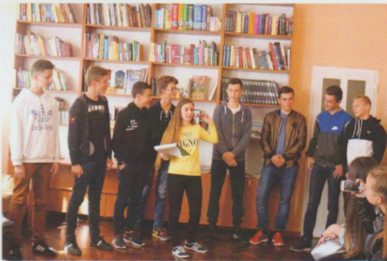
Козацькі ігри “Козацькому роду нема переводу”. Ужгородська ЦМБ