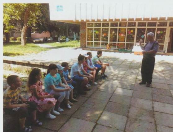
Свято “Подорож до країни Дитинства”. Свалявська РДБ