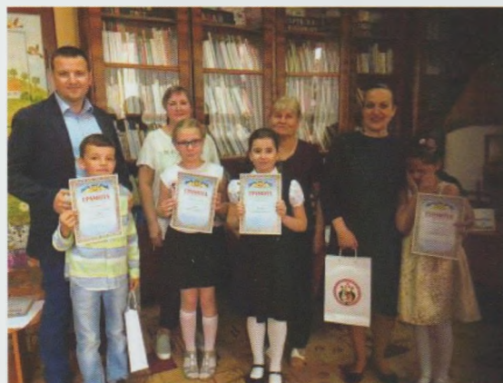
Родинне свято “Найкраща читаюча сім’я”. Закарпатська ОДЮБ