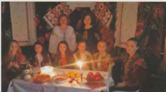
Андріївські вечорниці “Я в серці грію дівочу мрію!”. Б-ка-філія с. Вишоватий Тячівської ЦБС

спокійного життя. До Міжнародного дня миру працівники Іршавської районної бібліотеки спільно із старшокласниками ЗОШ № 1 провели акцію “МИ ЗА МИР”. Юні українці декламували вірші “Україно, ти моя молитва...”, “До українців”, співали патріотичних пісень. Готуючись до акції, молодь власноруч виготовила “голубів миру”, на яких вписала свої мрії та бажання.