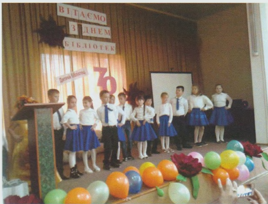
Музичне вітання учнів 4-Б класу Тячівської ЗОШ І-ІІІ ст. № 1 ім. В. Гренджі-Донського. Тячівська РДБ