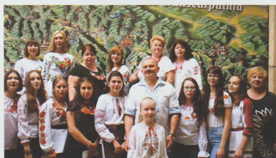
Міжрегіональний проект з профорієнтації учнівської молоді “ПрофіКемп”. Закарпатська ОДЮБ