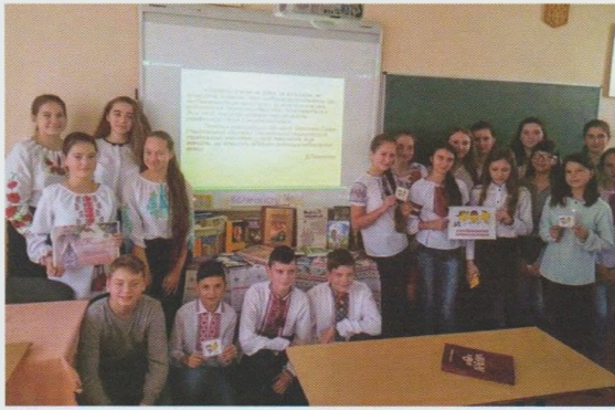
Пізнавально-виховний захід “З рідним словом міцніше держава”. Воловецька РДБ