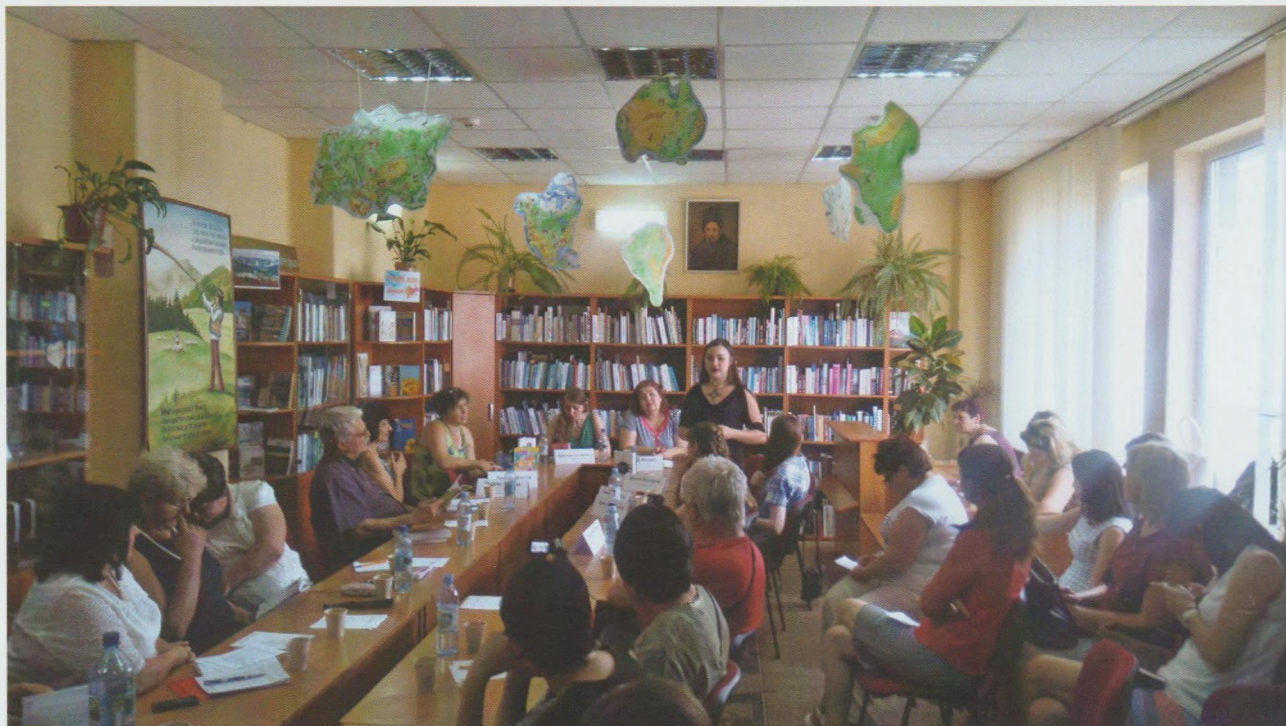
Всеукраїнський семінар "Орієнтири молоді в літературі: класики і сучасники". Закарпатська ОДЮБ

У поточному році спеціалізованими бібліотеками для дітей проведено 8 заходів, спрямованих на підвищення кваліфікації бібліотечних працівників області. Варті уваги проведені районні семінари: "Розвиток читацької компетентності дітей" (Рахівська РДБ); "Клуби та об'єднання за інтересами для дітей та юнацтва" (Перечинська РДБ); "Читання і діти: діапазон бібліотечних ідей і можливостей" (бібліотека-філія с. Білки Іршавської ЦБС); "Соціально-психологічні особливості спілкування бібліотекаря і дитини" (бібліотека-філія смт Буштино Тячівської ЦБС); "Бібліотека – середовище розвитку і впливу на читацькі вподобання юних користувачів" (Великобerezнянська РДБ); "Впровадження УДК в роботу публічних бібліотек" (Міжгірська РДБ).