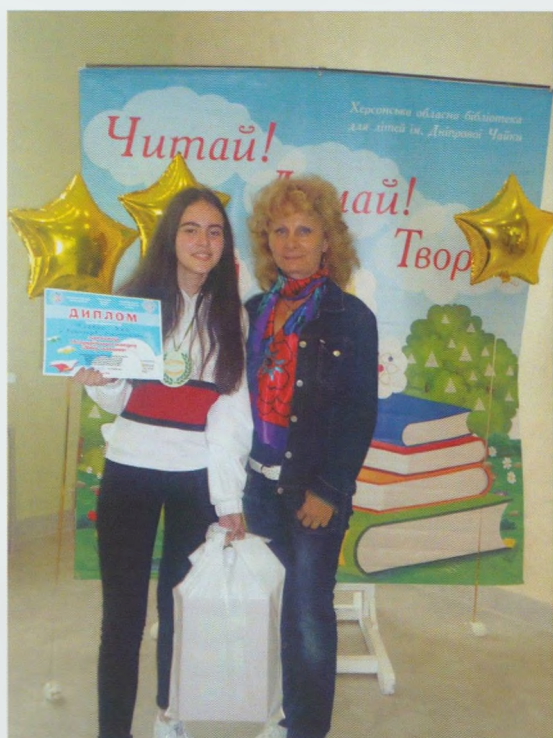
Переможець обласного етапу Всеукраїнського конкурсу "Лідер читання" на Херсонщині. Виноградівська РДБ