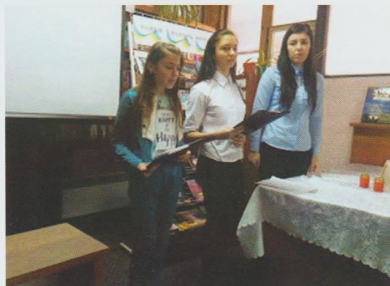
Вечір пам'яті “Час плине, а пам'ять залишається”. Великоберезнянська ЦРБ

Сьогодні молода людина – це головний читач для будь-якої бібліотеки. Формування її світогляду, інтелектуального потенціалу, духовності та моральності є призначенням бібліотеки як інформаційного, соціального, просвітницького закладу. Виховання почуття патріотизму, активної громадянської позиції нині визнані завданнями загальнодержавного масштабу. У бібліотеках області для юнацтва та молоді відбулися вечори пам'яті, тематичні вечори, літературно-музичні композиції, історичні години тощо.