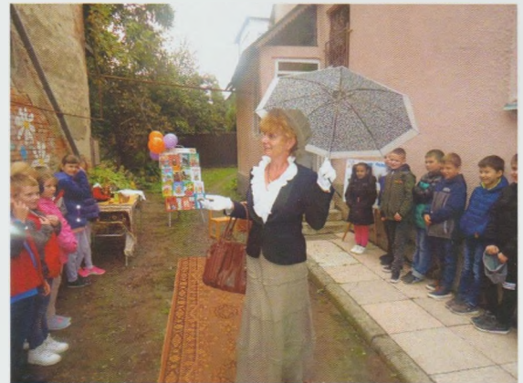
Казкова бібліотечна інтермедія. Виноградівська РДБ