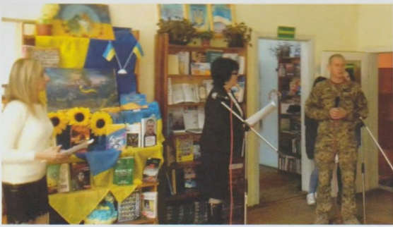
Вечір-зустріч “Події, що змінили долю України”. Воловецька ЦРБ