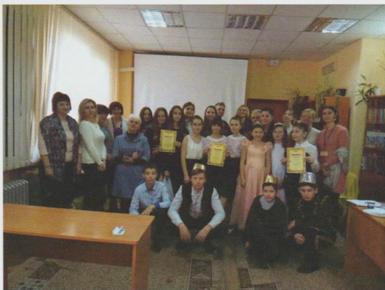
Обласний літературний конкурс “Молодіжний едельвейс”. Закарпатська ОДЮБ