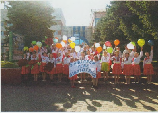
Флеш-моб з нагоди святкування 70-річчя від дня заснування бібліотеки. Тячівська РДБ