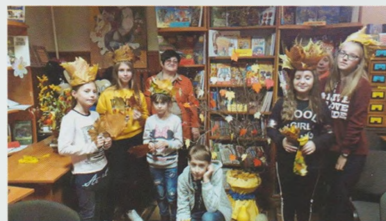
Літературний квест “Королева осінь”. Хустська РДБ