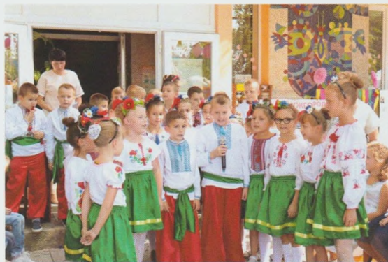
Свято “Живу, люблю і дихаю тобою моє найкраще місто на землі”. Ужгородська МДБ

У Хустській районній бібліотеці для дітей відбувся літературний квест “Королева осінь”. Під час виконання завдань квесту учасники знайомилися з художньою літературою, відповідали на запитання вікторин. Захід пройшов дуже цікаво, діти проявили свою спостережливість, спритність і винахідливість. Працівники бібліотеки оформили осінню фотозону, де дівчата та хлопці охоче фотографувалися. Квест доповнив майстер-клас, де учні виготовляли різні вироби із сухого осіннього листя. Наприкінці дітей гостинно частували солодощами.