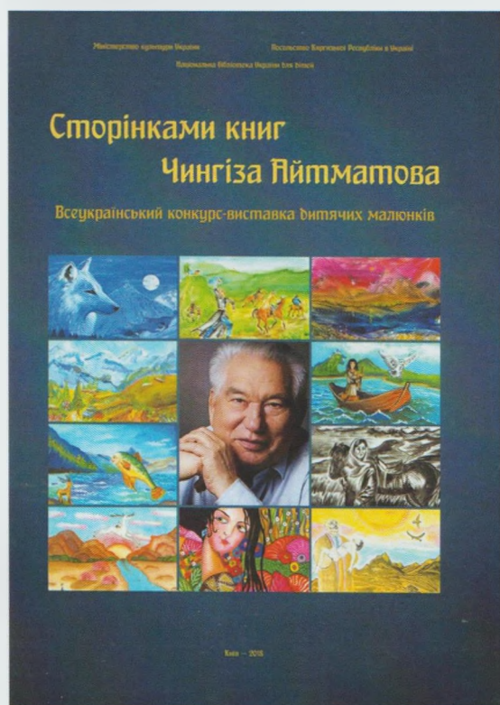
Колоритний альбом "Сторінками книг Чингіза Айтматова". Закарпатська ОДЮБ