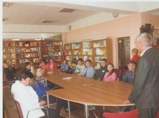
Клуб за інтересами для юнацтва “Орієнтир”. Ужгородська ЦРБ