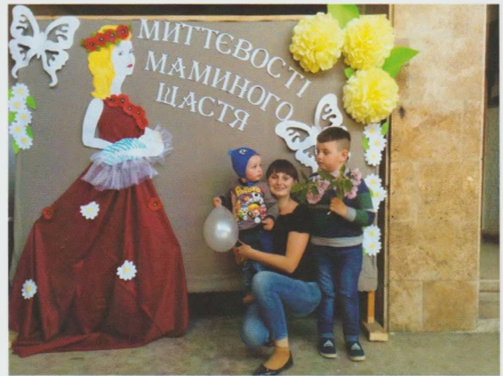
Фотозона “Миттєвості маминого щастя”. Великобerezнянська РДБ