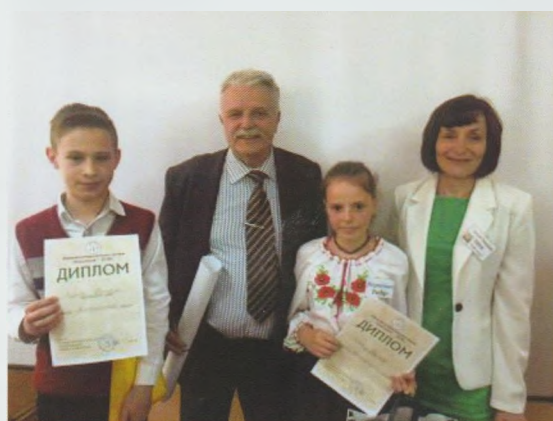
Переможці обласного туру Всеукраїнського конкурсу дитячого читання “Книгоманія – 2018” . Закарпатська ОДЮБ