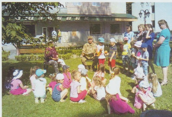
Акція просто неба. Міжгірська РДБ