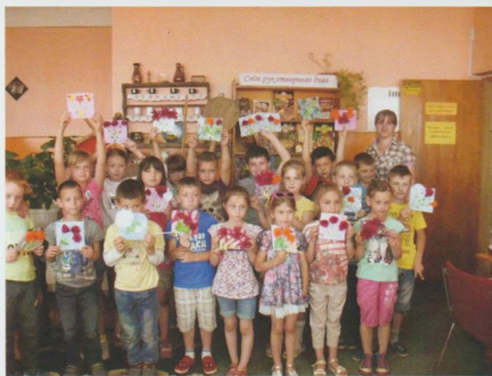
Майстер-клас з виготовлення листівки для мами. Ужгородська ЦРБ