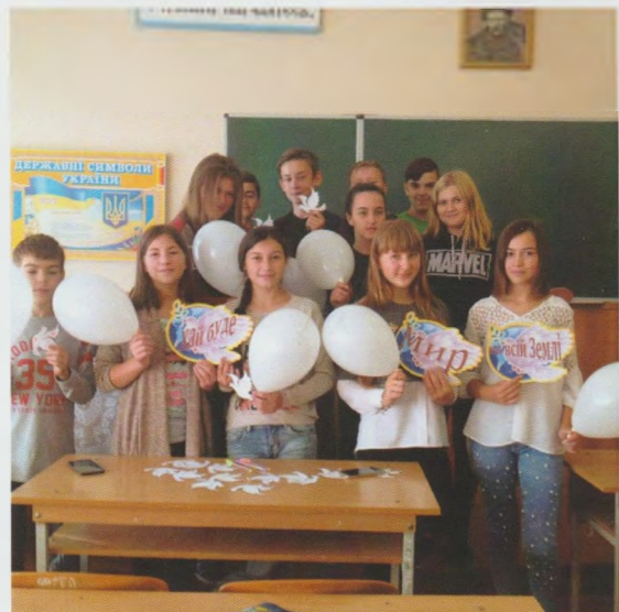
Акція “МИ ЗА МИР”. Іршавська ЦРБ