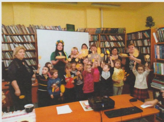
Дитячий ранок “Масляну зустрічай!”. Берегівська МДБ