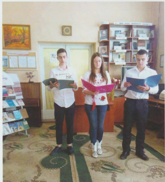
Свято рідної мови “Минуло все, лиш слово не мина”. Виноградівська ЦРБ