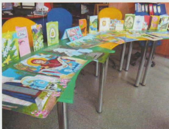
Конкурс “Від перлинок Слобожанщини до родзинок Закарпаття” . Херсонська ОДЮБ

26 книголюбів Закарпаття – учні 6-7 класів – приїхали на конкурс, щоб позмагатися за титул “Суперчитач Закарпаття” та виграти подорож до