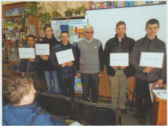
Вечір-спомин “За Вкраїну, за її волю стояли насмерть вояки”. Хустська РБ

Сьогодні для України мир має особливе значення. Кровопролиття на сході країни змінило всіх нас та наше усвідомлення цінності мирного і