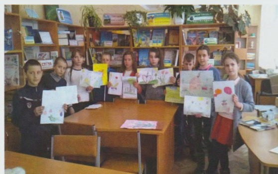
Еко-мандрівка “Збережемо первоцвіти”. Рахівська РДБ