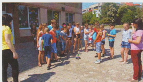
Майстер-клас зі збору іграшки-конструктора на сонячних батареях. Бібліотека-філія № 2 Ужгородської МЦБС