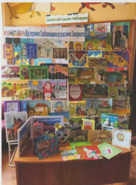
Конкурс “Від перлинок Слобожанщини до родзинок Закарпаття” . Закарпатська ОДЮБ